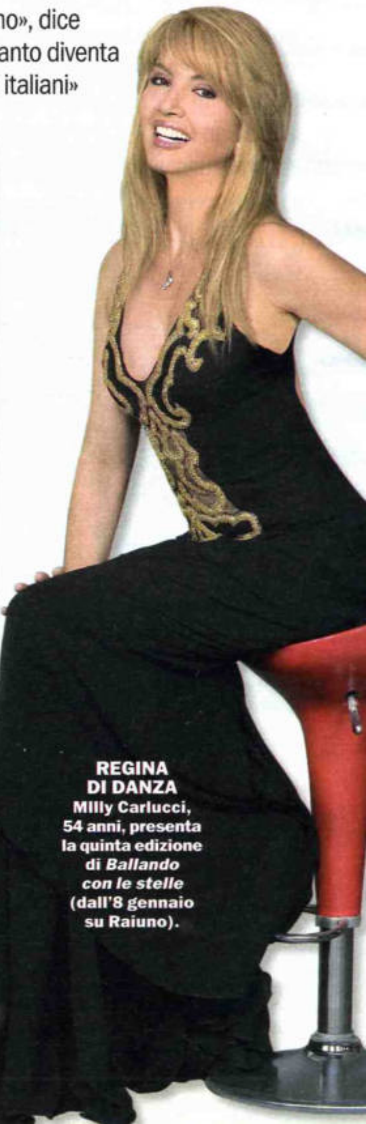
REGINA DI DANZA Milly Carlucci, 54 anni, presenta la quinta edizione di Ballando con le stelle (dall'8 gennaio su Raiuno).

«In Francia le nostre figlie sono al riparo dai pettegolezzi e conducono una vita tranquilla»